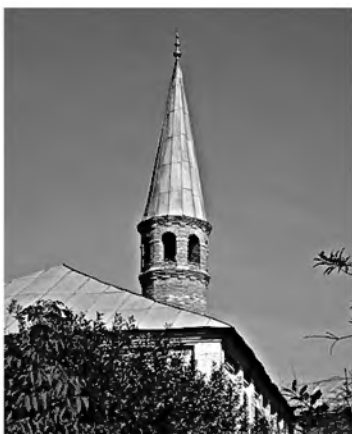
В мечети «Сулеймания» в Оренбурге действует музей, созданный по инициативе жительницы города Гульфарида Абу-